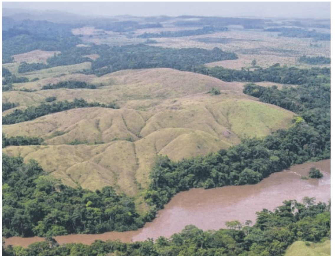
Le parc national de Moukalaba-Doudou figure parmi les nouveaux sites à présenter.

La mise à jour de cette liste a donné lieu, récemment au Musée national, à la tenue d'un atelier de validation présidé par le ministre Michel Menga M'Essone. Pour le membre du gouvernement, ces biens culturels constituent un vecteur d'attractivité touristique pour le Gabon, même sans être inscrits au patrimoine mondial de l'Unesco. Avec leurs spécificités physiques différentes, ils mettent en valeur l'énorme richesse naturelle (faune et flore), paléontologique et culturelle, parfois méconnue du grand public.